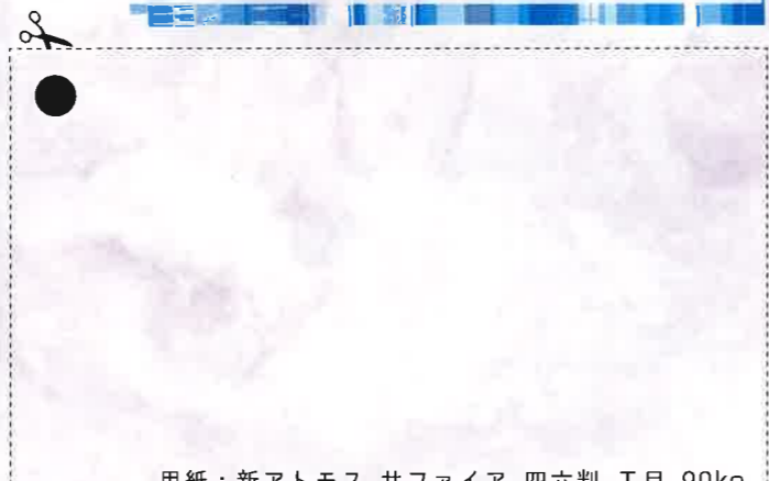
用紙：新アトモス サファイア 四六判 T目 90kg