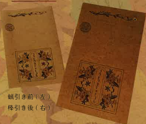
蝋引き前(左) 棒引き後(右)

紙の色が濃いので一見使い難いかな？と思うかもしれませんが 是非ともカラーで印刷していただきたいです(*o*)。* 1色でシンプルに仕上げるのもスタイリッシュで良いですが、 なんと！フルカラー印刷がとても映えるんですΣ(・ω・)！！ 沈んだ色がレトロ感を出してくれるので、 パッケージなどとても相性がいいかもしれません。